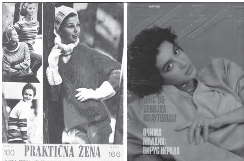
Najuticajniji domaći ženski magazini

da uticaj medijskih tekstova zavisi od onoga što odgovara društvenom iskustvu, ili u krajnjem slučaju, onoga što se uklapa u društveni horizont onih koji konzumiraju medijske tekstove (Daglas Kelner, 2004). Burda je motivisala ženu socijalizma da spozna sebe kroz model koji ne pripada njenoj kulturi i na taj način proširi svoj horizont, ne kao inferiorno lice utopljeno u masi, već samosvjesna individua koja ima pravo na javno prikazivanje, pa samim tim i djelovanje. Preko sasvim nove estetike Burda je podstakla tijelo da se otme uniformi bezličnog subjekta i spozna moć transformacije kroz kreativnost i novitet.