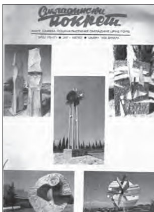
Časopis Omladinski pokret

Izrazito kolektivističko društvo, kakvo je crnogorsko, ignoriše mlade pojedince koji bi djelovali izvan istorijskih metanarativa i ekskluzivnosti originalnog imidža nacije, utemeljenog na sanjarenju, pretjerivanju i samoobmani. Mejnstrim je u socijalističkoj Crnoj Gori bio determinisan prvenstveno univokalnom percepcijom prošlosti, ratova, zatim zvaničnim diskursom u kulturi, podržanim samo onim što je u skladu sa vladajućom državnom politikom. Preko kulture,