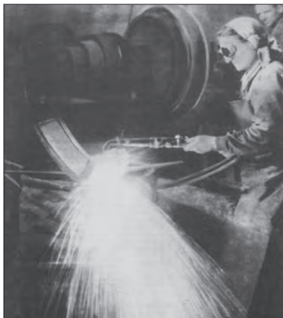
Žena varilac u fabrici