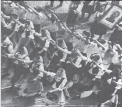
Paradni marš žena sa sela sa srpovima

Izučavajući moć ideologije marksizma, Hana Arent (Hannah Arendt), piše da se po Marksu „stvarna moć vladajuće klase nije sastojala u nasilju, niti se na njega oslanjala. Moć je bila određena ulogom vladajuće klase u društvu, ili još tačnije, njenom ulogom u procesu proizvodnje (Arent, 2002, 19).