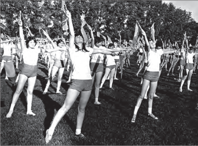
Uvježbavanje spektakla povodom Dana mladosti (sedamdesete godine)

epsko-ratnih mitova i folkloru, država je zapravo strateški sprovodila ulogu vaspitača, neospornog mjerila svih vrijednosti, a one su bile tradicionalne, moralno problematične i kontradiktorne, klasno neutralne i palanački introvertne, sklone autarhiji. Zato kultura mladih u Crnoj Gori koja je trebalo da bude generator prosperiteta, u kranjem, prosperiteta na nivou rodnih uloga i statusa, nije bila kultura otpora , poput one u Francuskoj koja je imala moć da utiče na političke promjene, ili one omladine u Americi, koja je uticala na zaustavljanje Vijetnamskog rata, omladine koja je podržala seksualnu revoluciju, feministički pokret... i tako dalje. Naprotiv, omladina je afirmisana kao besklasni dio društva, mehaničkog kolektivnog ustrojstva, očaranog mitovima i fiktivnom realnošću.