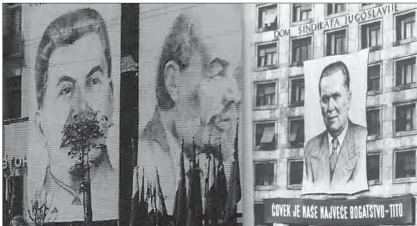
Portreti ideologa (Staljin, Lenjin i Tito)

elite. Politička reprezentacija istaknutih ličnosti tog doba imala je dvostruki smisao; prvi, koji se sastoji u projekciji fizičke persone a drugi u konstrukciji ideološkog i zajedničkog interesa društva. Prema mišljenju Alberta Bojma (Albert Boime), ovaj postupak „podrazumeva pronalaženje forme koja je posrednik između telesne osobe i transcendentalne ikone“ (Pejić, 1999, 142). Institucija tijela-na-vlasti funkcioniše kroz komunikacijski obrazac koji se zove sličnost . Lik je baziran na samo jednoj konstanti: na istinitosti lika. I zato je džinovska fotografija kao medij, kao javna predstava uživala veliko povjerenje – „ona je dokaz kome se vjeruje bez ostatka“ (Todić, 2001, 92).