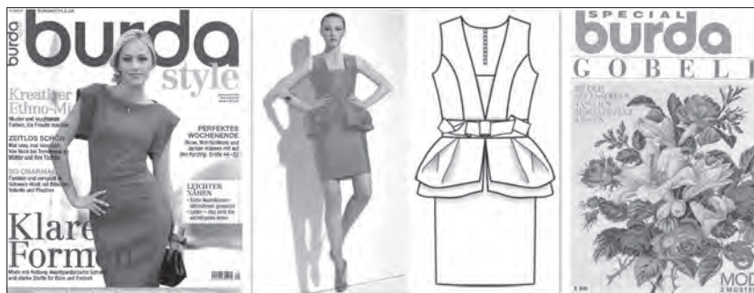
Ženski časopis Burda

Nakon ranog perioda preuzimanja sovjetskog herojskog modela, tzv. jugoslovenska žena već sedamdesetih, osim što je bila siromašnija, po malo čemu se razlikovala od bilo koje druge Evropljanke. Vesna Kesić zapaža da su „zahvaljujući socijalističkom ideološkom egalitarizmu, žene stekle vrlo značajnu formalnu, ali u ponečem i stvarnu pravnu i ekonomsku ravnopravnost. Satus u braku, legalizirani abortus, gotovo puna zaposlenost žena, iste plaće za iste poslove i tako dalje. U stvarnosti, prikriveni, i utoliko dublji, netematizirani patrijarhat vodio je klasičnu neravnopravnu distribuciju moći u socijalno podređeni položaj žena. One su uglavnom radile u niskoprofitnim industrijama, u profesionalnoj hijerarhiji napredovale su samo do određene razine i nisu igrale nikakvu ulogu u političkom životu zemlje. Javna je sfera često bila otvoreno seksistička i mizoginična, a obiteljsko nasilje prikriveno u privatnoj sferi“ (Kesić, 1994).