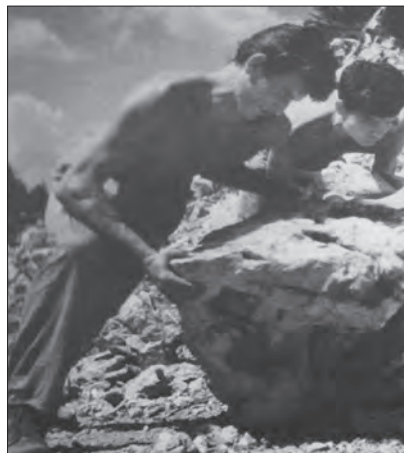
Radnik na pruži

problem, omladina u problemu) i da je nerijetko izazivala moralnu paniku , osnaženu strahom od amerikanizacije društva, nereda i ljenstvovanja, rušenja tradicionalnih vrijednosti i tabua (Hebdiđ, 1980). Po Hebdiđu, mladi ljudi na sebe skreću pažnju onoga trenutka kad pređu granice dozvoljene za igru sa moći koja im je na raspolaganju i kad predstavljaju prijetnju sistemu. Politika mladih je politika gesta, simbola i metafore, funkcioniše kroz znakove i semiotički otpor dominantnom poretku, a tako nešto među crnogorskom omladinom za vrijeme socijalizma sasvim je izostalo.