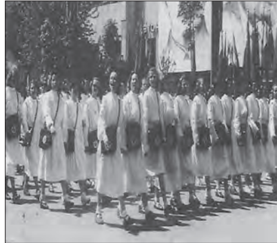
Medicinske sestre u paradnom koraku